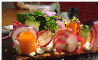
Restaurant «Côte à Côte» 04 82 77 08 22