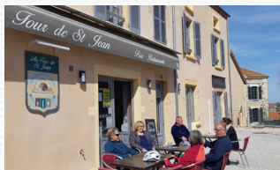
Restaurant «Au four de St Jean» 04 77 62 96 04