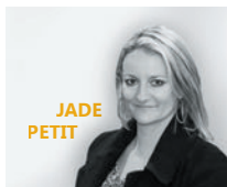
Conseillère communautaire déléguée à la culture et à la communication