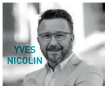
Président de Roannais Agglomération et Maire de Roanne