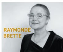
Vice-présidente en charge du tourisme et de la politique culturelle