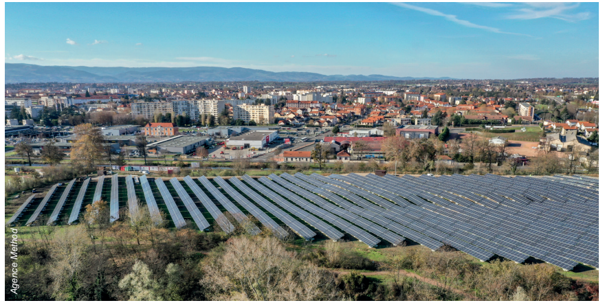
Située à Roanne, de part et d'autre de la rocade, la centrale solaire compte 16 500 panneaux photovoltaïques.

C'est vert, c'est local et c'est moins cher ! Les avantages de consommer de l'électricité verte ne sont plus à démontrer. Roannais Agglomération a fait le pari de développer les énergies renouvelables , avec plusieurs projets : solaire, éolien, méthanisation... Celui de la centrale photovoltaïque , pour lequel l'Agglo a investi 4 millions d'euros, est arrivé à son terme. Aujourd'hui, les habitants des 40 communes du territoire peuvent souscrire un contrat de fourniture d'électricité à un tarif inférieur de 10 % aux tarifs réglementés de l'électricité (sur la part variable). La centrale produira six gigawattheures par an, soit l'équivalent de la consommation de 1000 foyers . Le nombre de souscriptions est donc limité. Si vous êtes intéressés, rendez-vous sur le site du fournisseur planete-oui.fr .