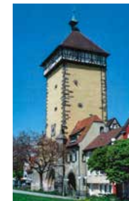
Tübingen Tor (Reutlingen)