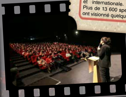
Mars 2019 : 10 ème édition de Ciné Court Animé dirigé par Loïc Portier