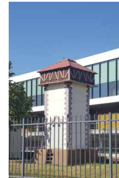
Tübingen Tor en modèle réduit (Roanne)

Tous les deux ans, les deux corps de sapeurs-pompiers se retrouvent pour entretenir des relations professionnelles et amicales. Et cela dure depuis un demi-siècle. Des échanges sur l'actualité de leur métier mais également sur la culture et le patrimoine des deux villes sont au programme.