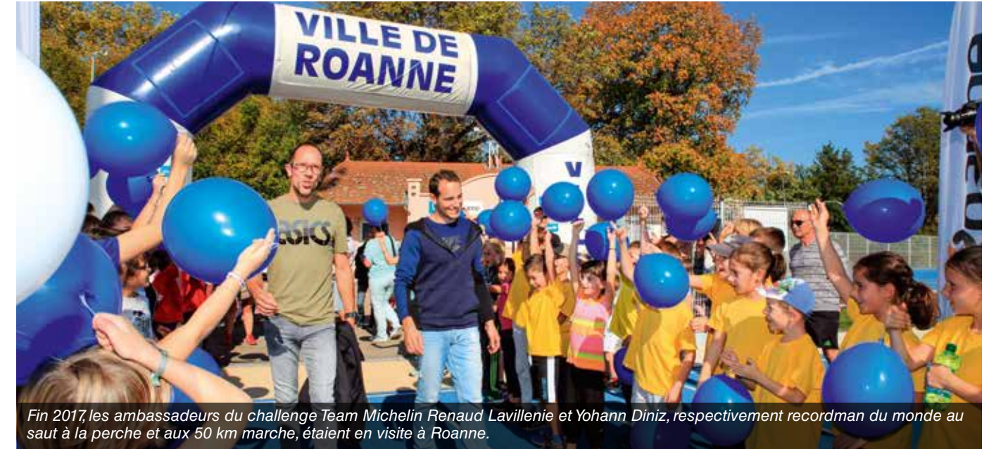
Fin 2017, les ambassadeurs du challenge Team Michelin Renaud Lavillenie et Yohann Diniz, respectivement recordman du monde au saut à la perche et aux 50 km marche, étaient en visite à Roanne.