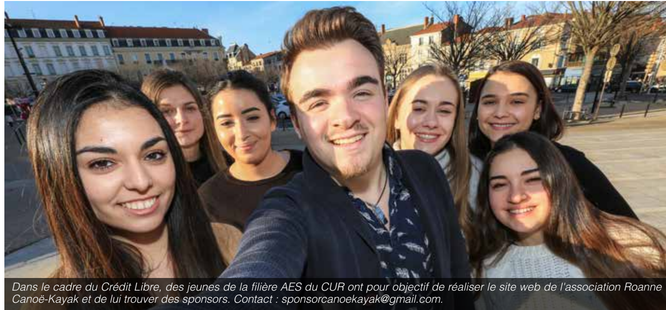
Dans le cadre du Crédit Libre, des jeunes de la filière AES du CUR ont pour objectif de réaliser le site web de l'association Roanne Canoë-Kayak et de lui trouver des sponsors. Contact : sponsorcanoekayak@gmail.com.