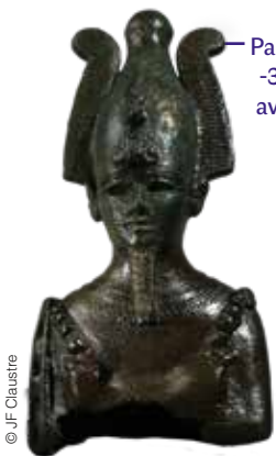
Partie supérieure d'un Osiris – Basse époque (-664 ; -332 avant J.-C.), avant la 26 ème dynastie (vers 660-528 avant notre ère.) – bronze.

À partir du 15 mars se tient au musée Joseph-Déchelette une expositions exceptionnelle : Muséalies # 2 – Faces, masques et portraits - L'atelier Picasso. L'occasion de découvrir des toiles, sculptures, lithographies... fabuleuses, le qualificatif n'est pas galvaudé. Visite guidée.