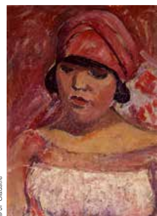
Portrait de Jeune fille au turban – 1913 – huile sur toile – Jean PUY

On ne présente plus Jean Puy, grand peintre Roannais et membre de la peinture d'Avant-Garde ! Cette jeune fille au turban traitée à l'orientale fait partie des plus belles œuvres de l'artiste.