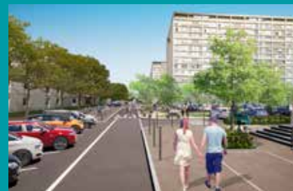
Agence Trace paysage et aménagement