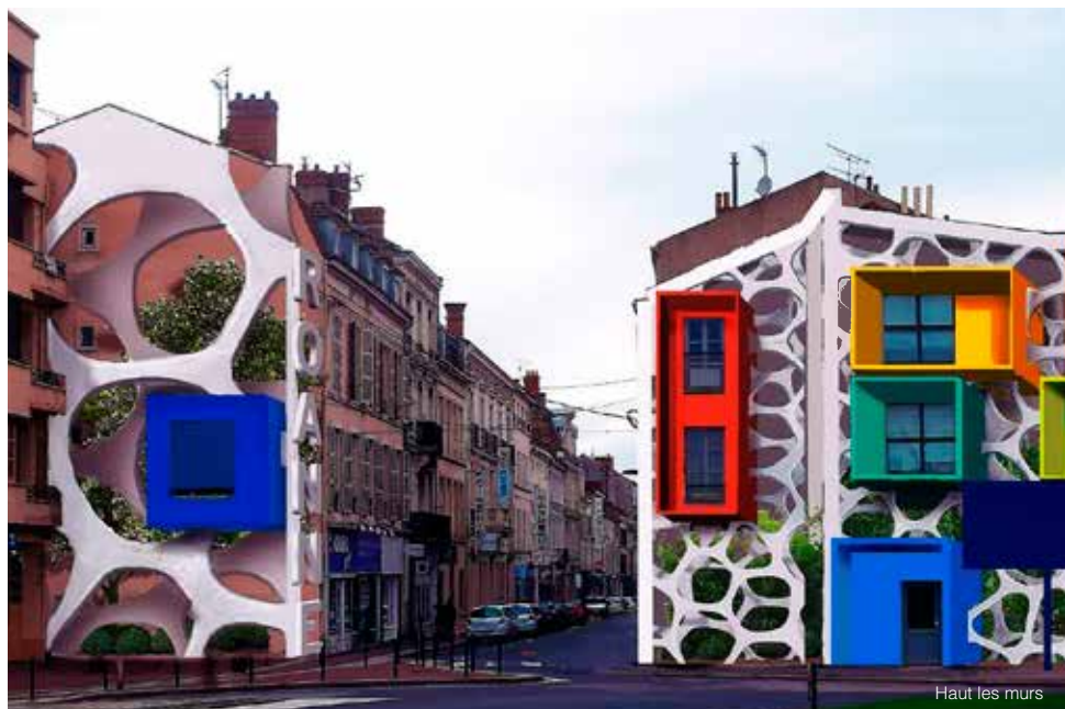
Haut les murs

mars 20 Le lancement de la 73 ème campagne de Jeunesse au plein air a été l'occasion pour les élèves de l'école Fuyant de présenter la vignette 2018. Cette fameuse vignette doit permettre à plusieurs milliers de jeunes, qui n'ont pas les moyens, de partir en vacances.