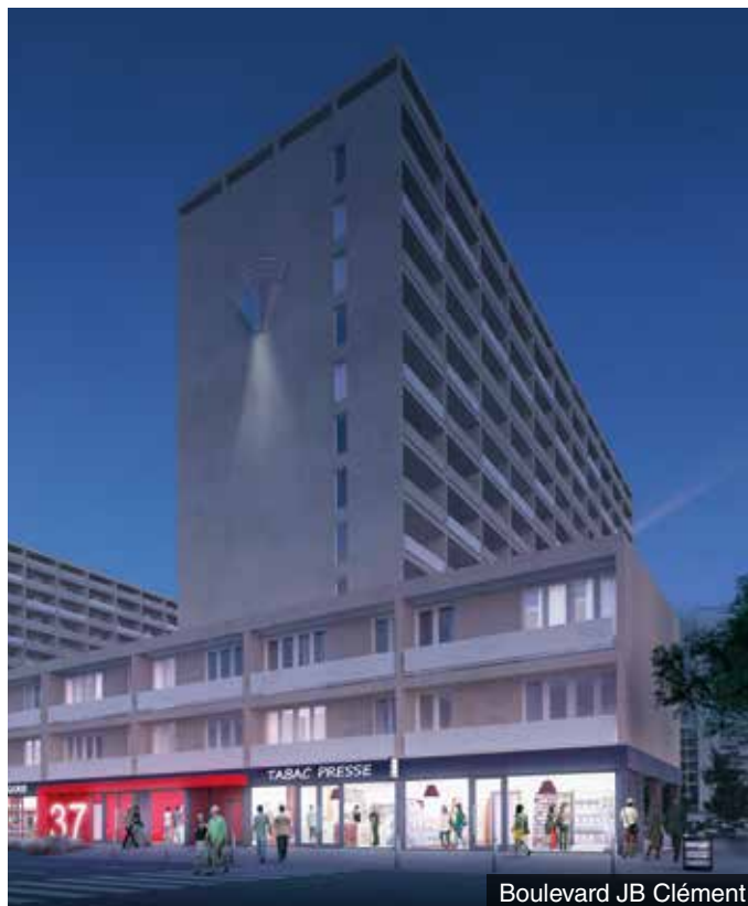
Boulevard JB Clément