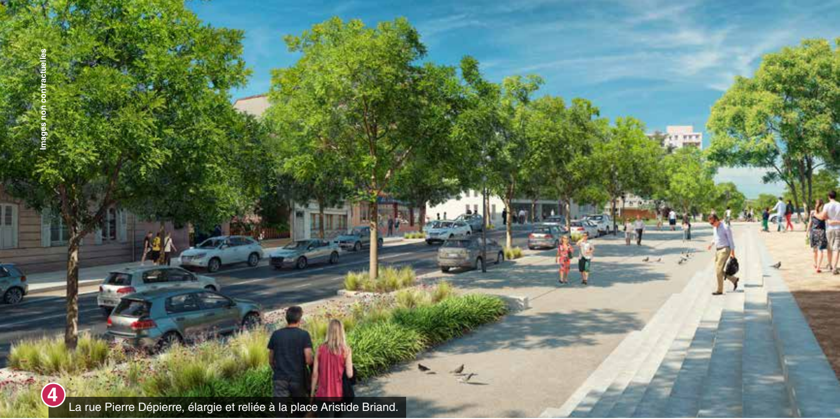
La rue Pierre Dépierre, élargie et reliée à la place Aristide Briand.