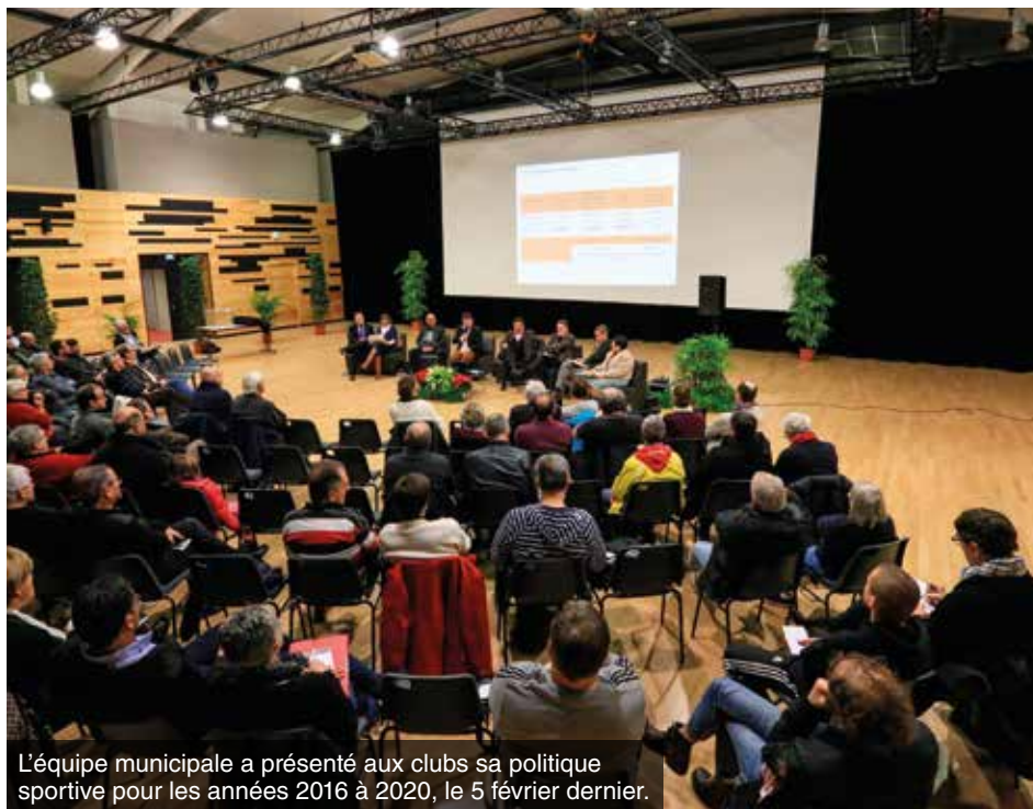
L'équipe municipale a présenté aux clubs sa politique sportive pour les années 2016 à 2020, le 5 février dernier.