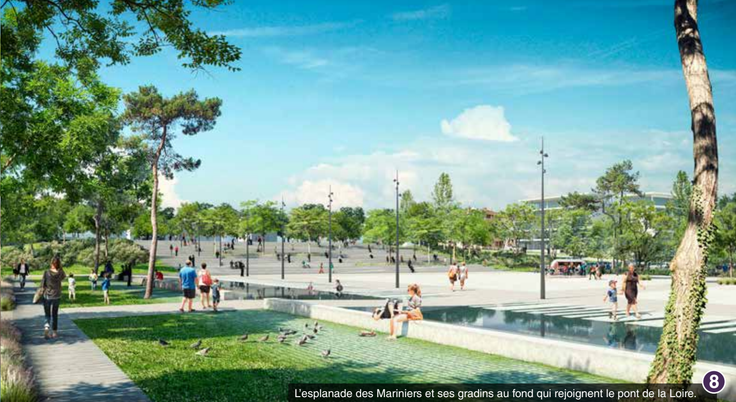
L'esplanade des Mariniers et ses gradins au fond qui rejoignent le pont de la Loire.