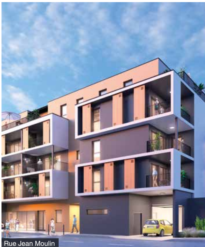
Rue Jean Moulin