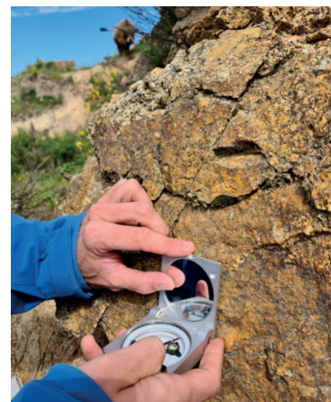
Exemple de mesure d'un plan de faille avec une boussole de géologue.

Objectif ? Déterminer le site offrant le meilleur potentiel géothermique d'ici 2027.