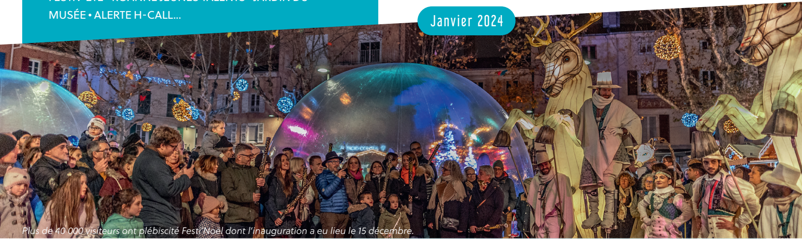
Plus de 40 000 visiteurs ont plébiscité Festi'Noël dont l'inauguration a eu lieu le 15 décembre.