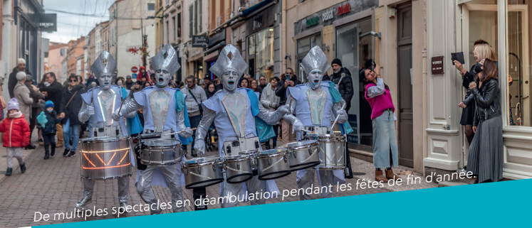
De multiples spectacles en déambulation pendant les fêtes de fin d'année.