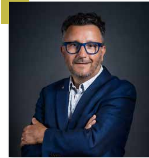
Chères Roannaises, chers Roannais,

Avec mon équipe, nous nous sommes engagés à vous rendre régulièrement compte des actions et des projets que nous réalisons et que nous construisons avec vous. Pour rendre notre ville encore plus dynamique. Encore plus attractive. Et encore plus agréable à vivre.